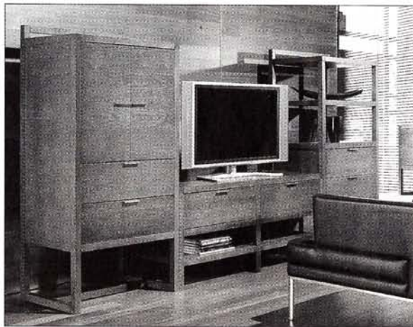
Les meubles de la nouvelle collection Berlin de Baronet se caractérisent par la pureté de leurs lignes.